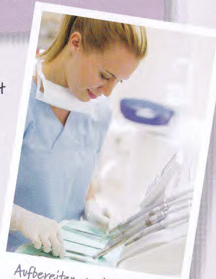
Aufbereiten von Instrumenten

Tipp: Ein Praktikum in einer Zahnarztpraxis vermittelt Dir erste Eindrücke von deiner zukünftigen Tätigkeit.