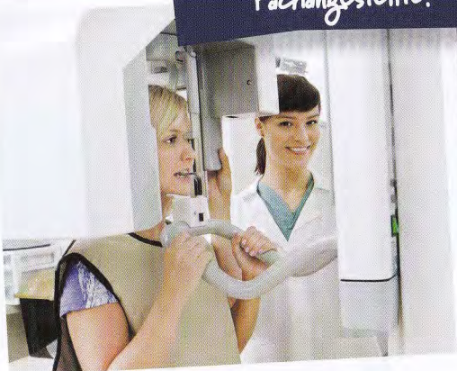
Erstellen von Röntgenaufnahmen

Dann werde Zahnmedizinische Fachangestellte!