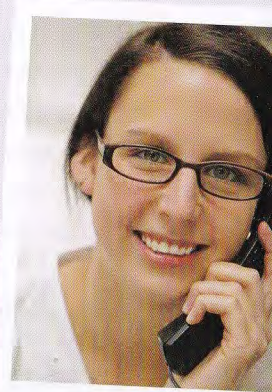
Praxisorganisation und Verwaltung

Zahnmedizinische Fachangestellte können alle Frauen und Männer mit einem Real- oder Hauptschulabschluss oder Abitur werden.